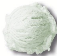
Citron-citron vert (sorbet)